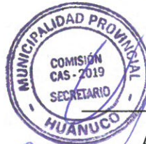
[Handwritten signature] Abog. Baltazar Vara Berrospi Secretario